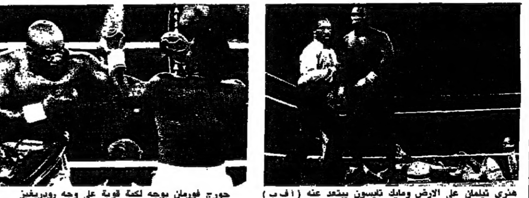
جورج فورمان يوجه لكمه قوية على وجه رودريغيز

دقائق و ٤٧ ثانية فقط كانت كافية للملك الأمريكي مايك تايسون بطل العالم السابق لوزن الثقيل للقب الموحد لكي يفوز بالضربة القاضية على مواطنه هنري تيلمان في المباراة التي أقيمت فجر الأحد على حلبة سينتر بالاس في لاس فيغاس بولاية نيفادا، وكان من المقرر أن تستمر جولة جولاً.